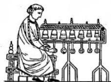
Carillon (xiii e s.).

N°202 « Eau et Feu des Vosges du Nord » sous le patronage de Sainte Odile De Reichshoffen-Niederbronn-Dambach- Neunhoffer-Nehwiller-Jaegerthal-Windstein