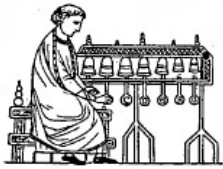
Carillon (XIII e s.).