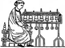
Carillon (XIII e s.).

N°195 « Eau et Feu des Vosges du Nord » sous le patronage de Sainte Odile De Reichshoffen-Niederbronn-Dambach- Neunhoffen-Nehwiller-Jaegerthal-Windstein